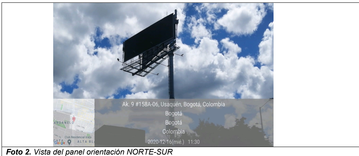
Foto 2. Vista del panel orientación NORTE-SUR