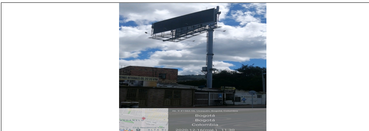
Foto 1. Vista panorámica del predio, del mástil, y de la estructura, de la valla, en buenas condiciones y estable, ubicada en la Carrera 8G BIS No. 159B-11 (Dirección catastral) orientación NORTE-SUR.